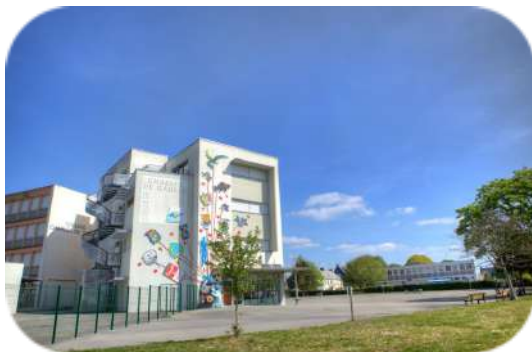
Collège Charles de Gaulle