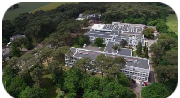
Etablissement de l'EREA (internat)