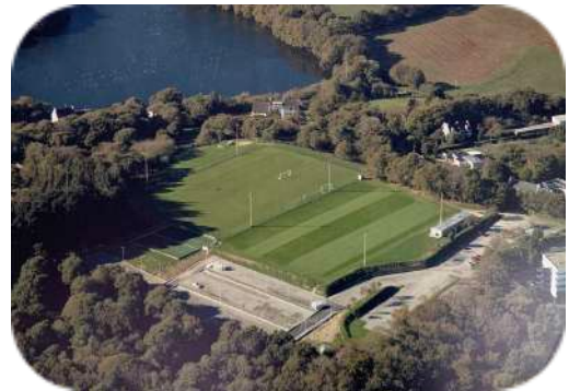
Centre d'entraînement Féminin du FC LORIENT